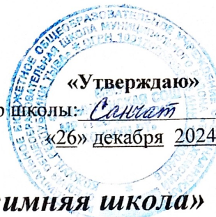
График консультаций «зимняя школа»